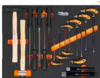
BW 96T 2-2,5-3-4-5-6-7-8 mm BW 34 150-175 mm BW 1370 300 g BW 1390 35 mm BW 1719BMA/IQ 200 mm BW 1719BMA/T 200 mm BW 1719BMA/P 200 mm BW 1719BMA/M 200 mm BW 1719BMA/R 200 mm