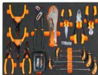
BW 97TTX T10-T15-T20-T25-T30 BW 1038 19+60 mm BW 1036 19+60 mm BW 1034 19+60 mm BW 1032 19+60 mm BW 1166BM 160 mm BW 1150BM 180 mm BW 1082BM 160 mm BW 1052 240 mm BW 1048 250 mm