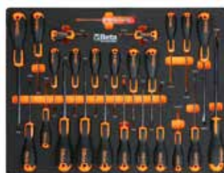
BW 1282E PH0x50-PH1x80-PH2x100-PH3x150 mm BW 1282EN PH1x30 mm BW 1287E/TX T6-T7-T8-T9-T10-T15-T20-T25-T27-T30-T40-T45 BW 1281EN 4x30 mm BW 1281E 2,5x50-3x75-4x100-5,5x125-6,5x150-8x200 mm BW 1253 3x100 mm