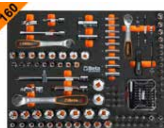
BW 900 4-4,5-5-5,5-6-7-8-9-10-11-12-13-14 mm BW 900L 5-6-7-8-9-10-11-12-13 mm BW 900LP 0,8x4-1,0x5,5-1,2x6,5-1,2x8,0 mm BW 900PH PH1-PH2-PH3 BW 900ME 3-4-5-6-7 mm BW 900TX T10-T15-T20-T25-T27-T30 BW 900/20 50 mm BW 900/20L 100 mm BW 900/25 150 mm BW 900/30 150 mm BW 900/1 1/4" - 1/2" - 3/8" BW 900/42 115 mm BW 900/55 125 mm BW 900/42 115 mm