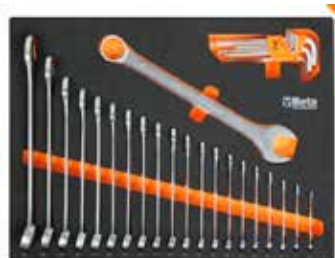
BW 96BPC/SC9 BW 42 1,5-2-2,5-3-4-5-6-8-10 mm 6-7-8-9-10-11-12-13-14-15-16-17-18-19-20-21-22-24-27-30-32 mm