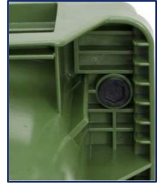
Alojamiento para chip