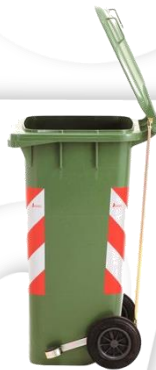
Apertura con pedal