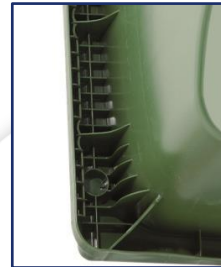
Agarre tipo peine