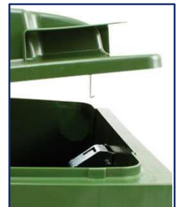
Cerradura de gravedad