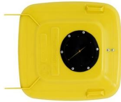
Tapa con boca de fuelle 160 mm