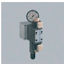
» Regulador presión mordaza