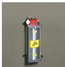
» Dispositivo de corte en seco