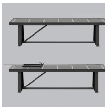
» Camino de rodillos