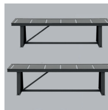
» Caminos de rodillos