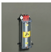
» Dispositivo de corte en seco