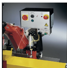
» Bajada controlada