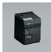
» Variador electrónico