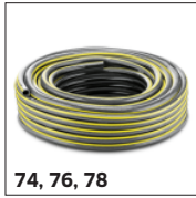
74, 76, 78