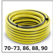
70-73, 86, 88, 90