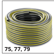
75, 77, 79